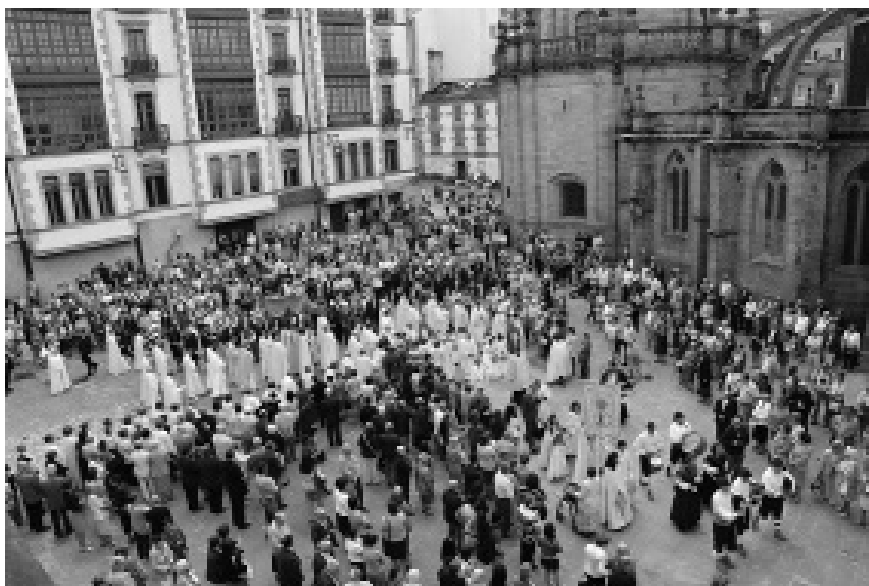
Procesión do Corpus na praza de Santa María

Facéndose eco das palabras do papa Francisco, Mons. Alfonso Carrasco, recordounos que “se unicamente miramos a forza ou o diñeiro, o que move este mundo, a cantos non descartaremos?; non podemos guiarnos polo valor do diñeiro nin polo poder, porque iso lévanos a desprezar e minusvalorar ao próximo. Sen fe, sen saber cal é o verdadeiro valor que cada un de nós ten aos ollos do Señor, podemos caer na terrible cultura do descarte”.