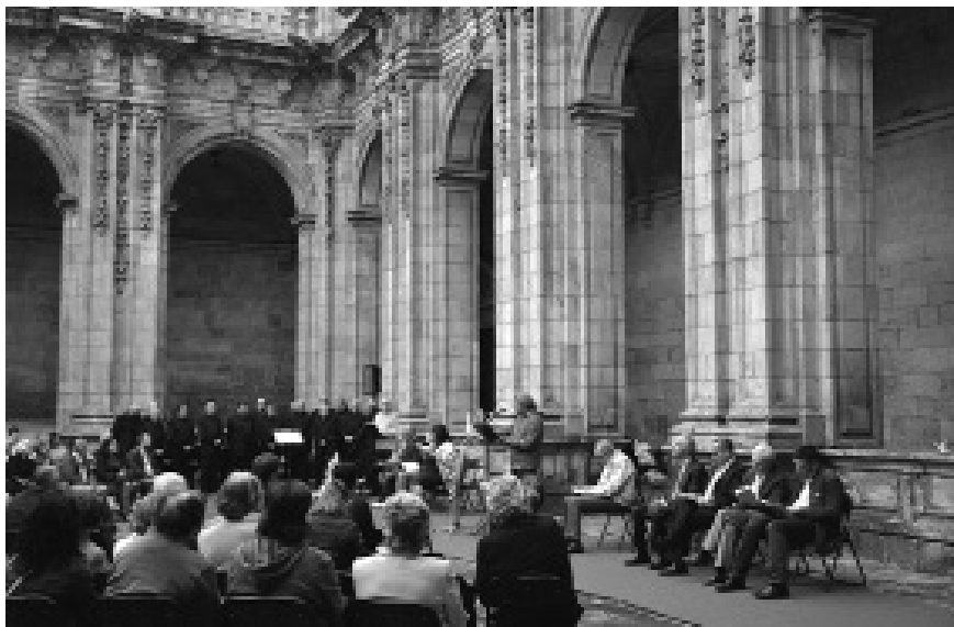
Celebración da Summa Poética no claustro da Catedral

O culto e a fe eucarística foi fonte de inspiración para poetas e músicos de todos os tempos. Con este acto inténtase recuperar unha tradición do Corpus lucense que organizaba un concurso de poesía eucarística. Hoxe en día esta actividade consiste na lectura pública de poemas de autores coñecidos como Díaz Castro, Ramón Cabanillas, Cervantes ou García Lorca.