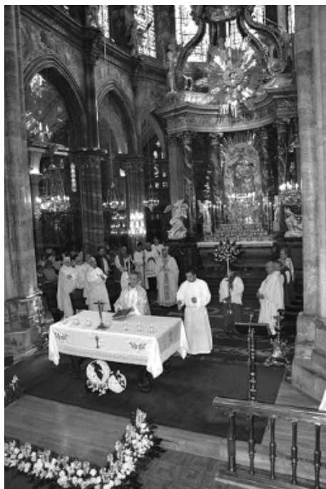
Misa do Corpus na Catedral