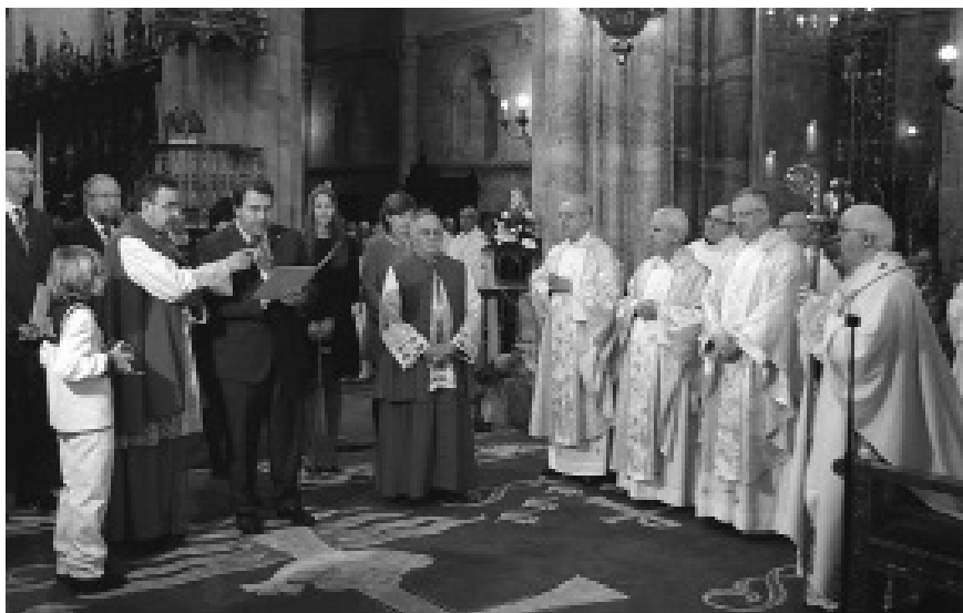
Momento da Ofrenda do Antigo Reino de Galicia o Santísimo Sacramento

Invocou a protección do Santísimo Sacramento para renacer máis solidarios cos que sofren, os enfermos, anciáns, parados... E, apelando á necesidade dunha convivencia harmónica, lembrou que os galegos, que “tantas veces tiveron que saír ao mundo en procura dun porvir, saben moi ben o que significa integrar no canto de separar, compartir no canto de danar e convivir no canto de rexeitar”.