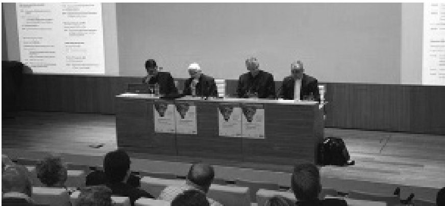
O cardeal Antonio Cañizares impartiu a primeira das conferencias sobre a Eucaristía

O cardeal Antonio Cañizares, prefecto da Congregación para o Culto Divino e a Disciplina dos Sacramentos, impartiu dúas conferencias sobre a Eucaristía, a primeira o día 19 en Lugo, sobre a Eucaristía como “corazón pulsante da Igrexa”.