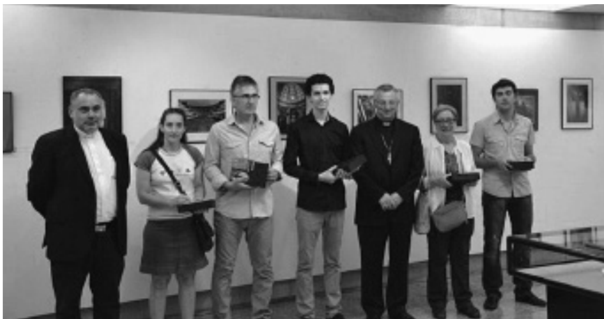
O Bispo de Lugo e o director do LEC en compañía dos premiados