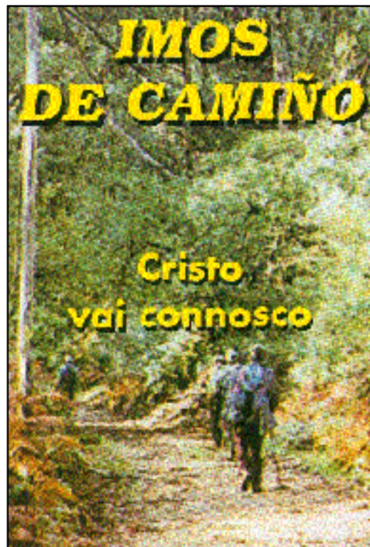
No Camiño da vida, ¿cal é a túa meta?. A catequese deste curso incide no tema do camiño do cristián.

Na xornada de apertura presentaranse os obxectivos para este curso, materiais, criterios e actividades para utilizar na catequese. O Obxectivo xeral deste curso é promover unha catequese ó servizo da iniciación cristiá. Para elo analizarase a realidade catequética para descubrir os retos que se lle plantexan hoxe á educación da fe na nosa Igrexa; propiciárase unha reflexión conxunta de cara a artellar un itinerario global de iniciación cristiá e tentárase concienciar ós axentes da catequese de que a súa tarefa esixe conversión persoal, a maduración na fe e a testemuña de vida.