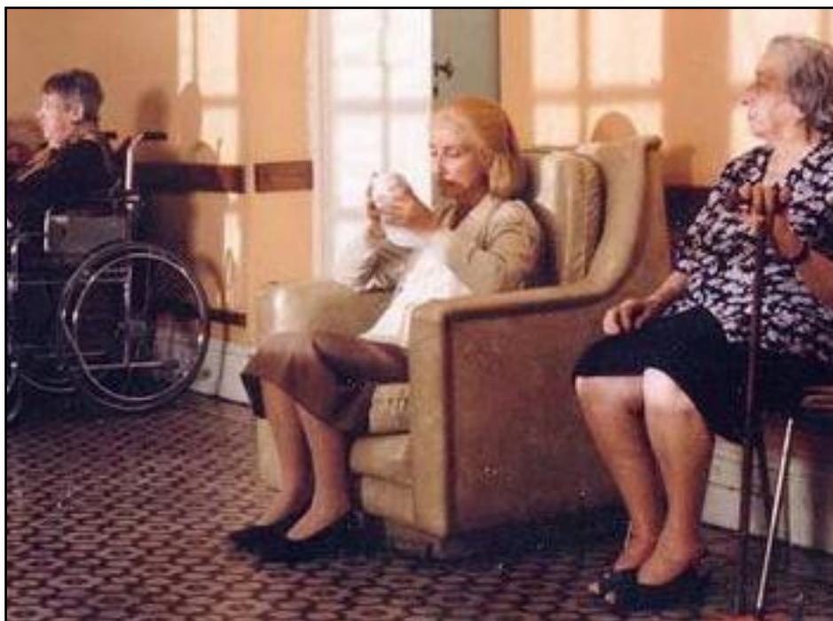
A actriz Norma Alejandro interpretou a unha muller enferma de Alzheimer na película "El hijo de la novia".

Aproximadamente diagnosticouse a enfermidade a máis de 500.000 persoas en España, aínda que se fala dun total de 800.000 enfermos entre diagnosticados e non diagnosticados. Estímase que no ano 2025 duplicarase o número de enfermos.