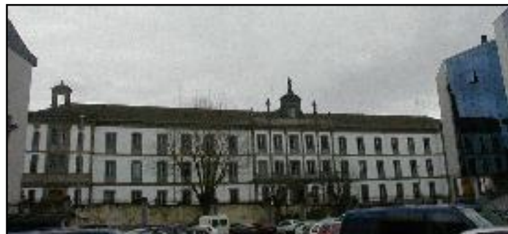
O Seminario de Lugo acolle este ano a 110 alumnos

á institución como interno, mediopensionista ou externo. Neste curso 2003-2004 no Seminario menor hai un total de 110 alumnos, cursando Estudos Eclesiásticos 16, e facendo as prácticas pastorais dous.