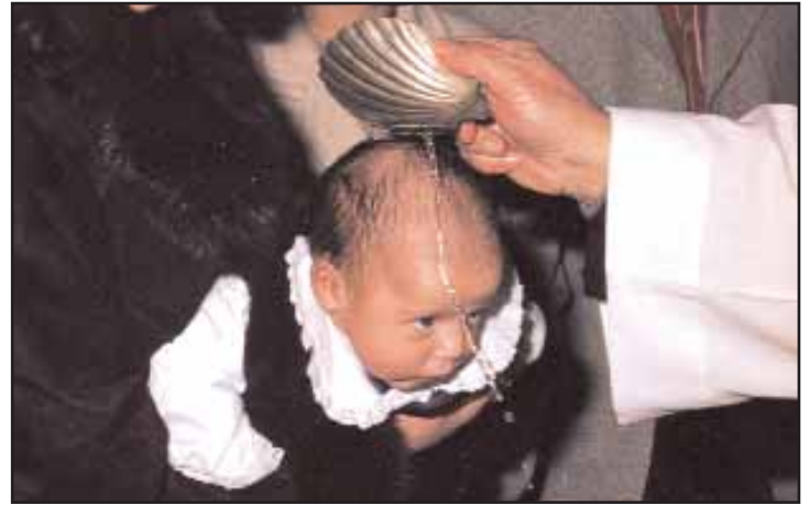
A convocatoria parroquial é practicamente sacramental, sendo difícil reunir na parroquia á freguesía para outra finalidade.

Precisamente a causa do sacramental, a parroquia subsiste como lugar privilexiado do catolicismo popular, caracterizado pola súa ritualidade sacramental. Os "católicos" teñen contacto coa parroquia mediante certas