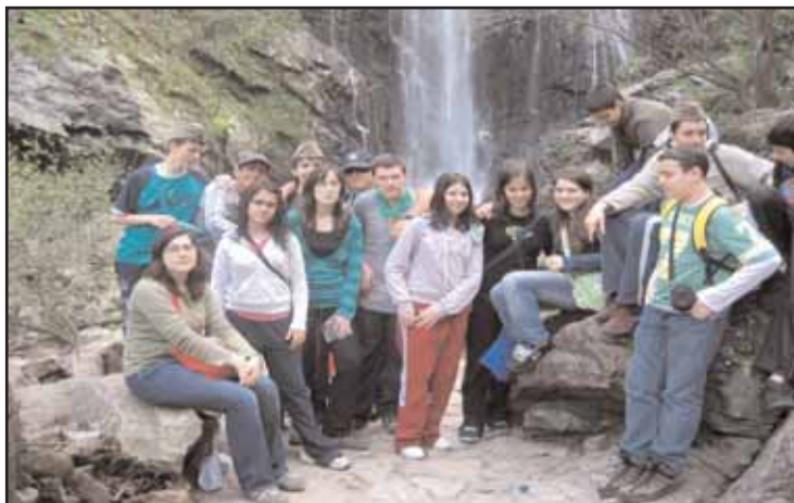
Actividades no colexio Divina Pastora e nun campamento