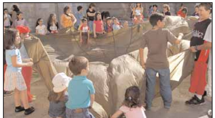
A última actividade que Cáritas desenvolveu de cara ós nenos foi na campaña do Día da Caridade

Outra das actividades do programa de atención á xuventude de Cáritas é a organización dunha acampada. É unha actividade dirixida a adolescentes coa finalidade de espertar o interese pola