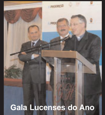
Gala Lucenses do Ano