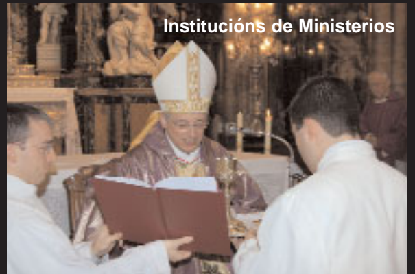
Institucións de Ministerios