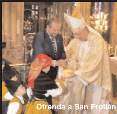
Ofrenda a San Froilán