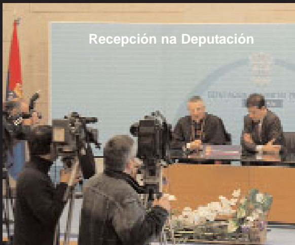
Recepción na Deputación

O pasado 9 de febreiro cumpríuse un ano da ordenación episcopal do Bispo da Diocese. Un ano cheo de actividades en todos os ámbitos da vida social e diocesana de Lugo