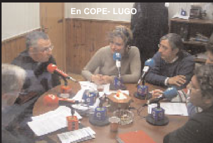
En COPE- LUGO